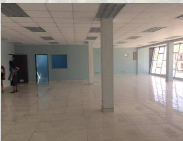
Fig. 4 – Foto en el Segundo piso – Cocina y Sala de comer a la izquierda, fondo.