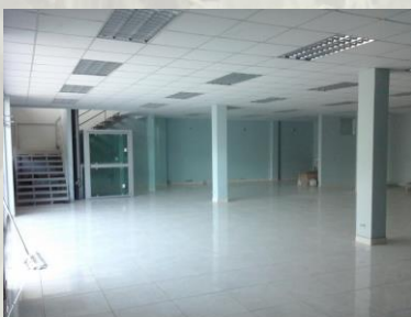
Fig. 6 – Foto mirando a las escaleras y ascensor