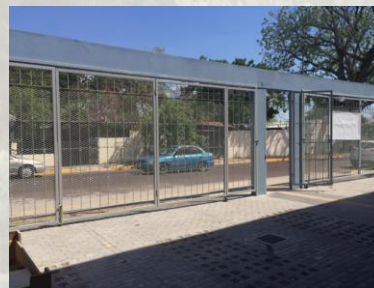
Fig. 2 – Foto del exterior en el primer piso con 6 parque privado.