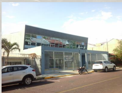
Fig. 1 – Foto de la calle.

Oramos que las iglesias que están apoyándonos van acompañarnos en hacer este proyecto una realidad. La más Iglesias que tenemos participando, menos la carga. Yo voy hacer de mi parte acerca de la construcción del interior del edificio incluyendo el aire acondicionado. Yo he hablado con algunos pastores nacionales y ellos están muy animados acerca del Colegio Bíblico y Seminario. Ya puse un currículo de estudios para el Colegio Bíblico y Seminario. Vea abajo las fotos del edificio y también en una forma Pdf.