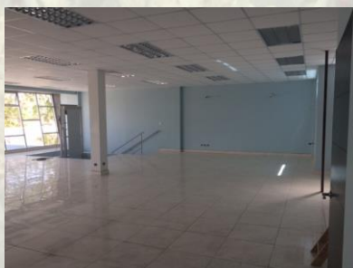
Fig. 5 – Foto en Segundo piso mirando a las escaleras